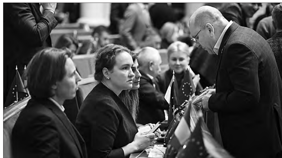
Під час засідання.

Європейський моніторинговий центр з наркотиків та наркотичної залежності, що функціонує як агенція ЄС, яка досліджує питання наркополітики в державах-членах, у 2018 році оприлюднив оновлені рекомендації, у яких зазначив, що попри різні підходи щодо забезпечення доступу пацієнтів до ліків та препаратів, виготовлених із конопель, європейські держави та