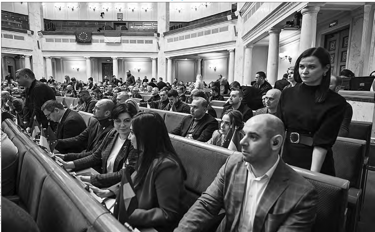
Більше фото тут — www.golos.com.ua