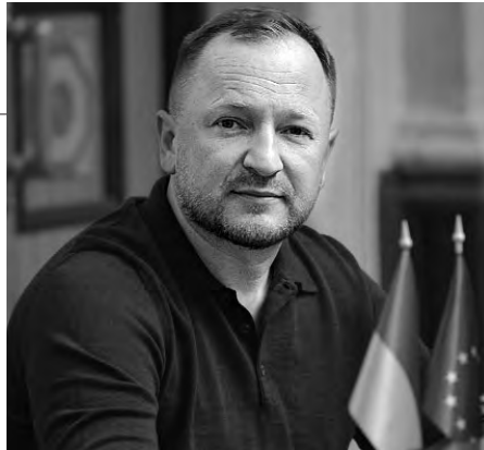
Народний депутат від фракції «Слуга народу» Павло СУШКО.